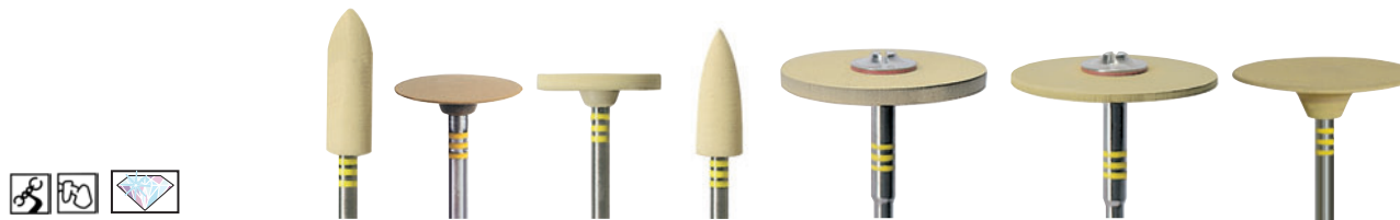
Hochglanzpolieren • High-Shine Polishing • Glaçage