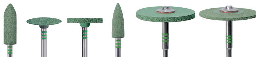
Vorpulieren • Pre-Polishing • Prépolissage