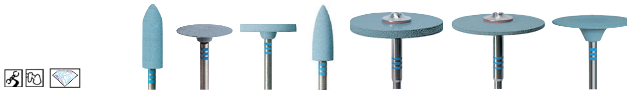
Glanzpolieren • Refined Finish • Polissage