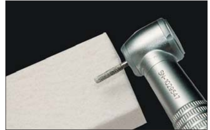
Abb. verkleinert/reduced size/illustration réduite