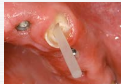
FiberMaster konisch ohne Kopf