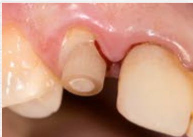
TopHead SAR Rescue System